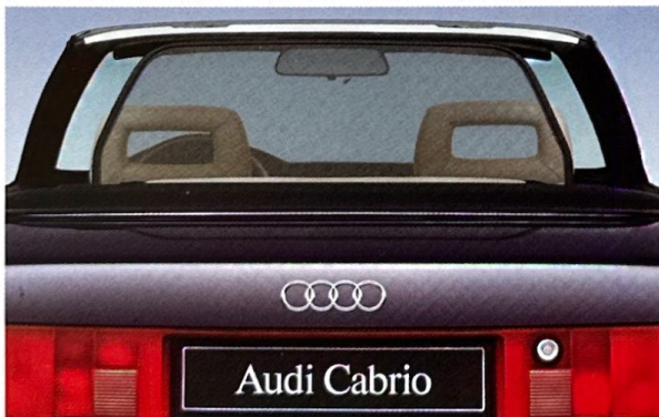
Bei Einsatz des Windschotts werden typische Luftwirbel auf ein Minimum reduziert.

Hinzu kommen der hohe Qualitätsstandard,