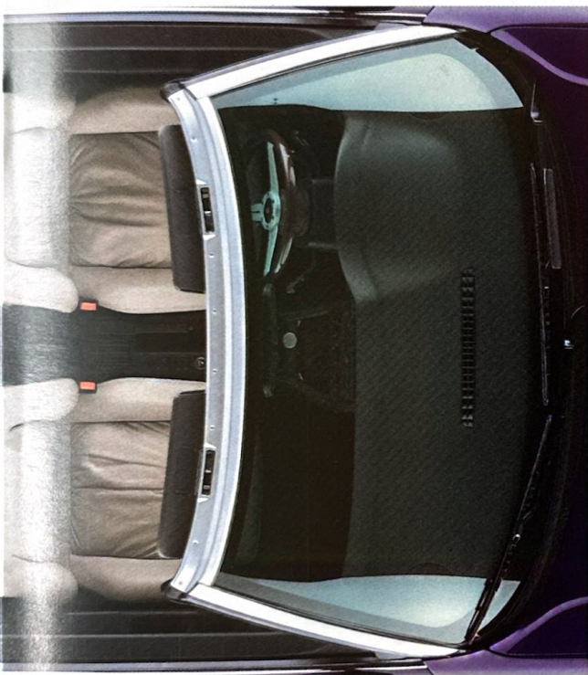
Die Innenausstattung in hochwertigem Kodiak-Leder.