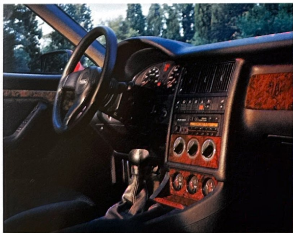
Das ergonomisch gestaltete Cockpit: außergewöhnlich formschön und beispielhaft funktional.